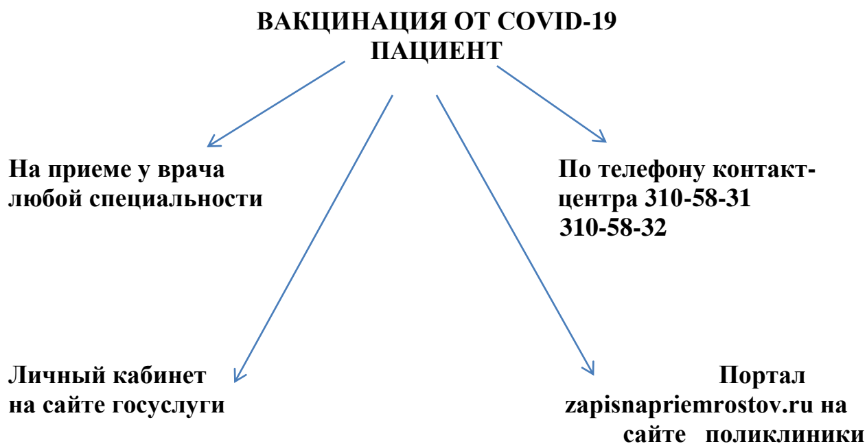
Схема маршрутизации пациентов при проведении ВАКЦИНАЦИИ ОТ COVID-19 взрослого населения в МБУЗ "Городская поликлиника №16 г. Ростова-на-Дону"